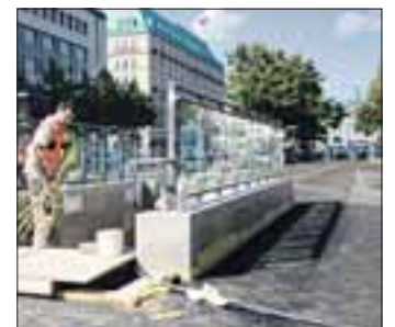
U-Bahnhof Brandenburger Tor