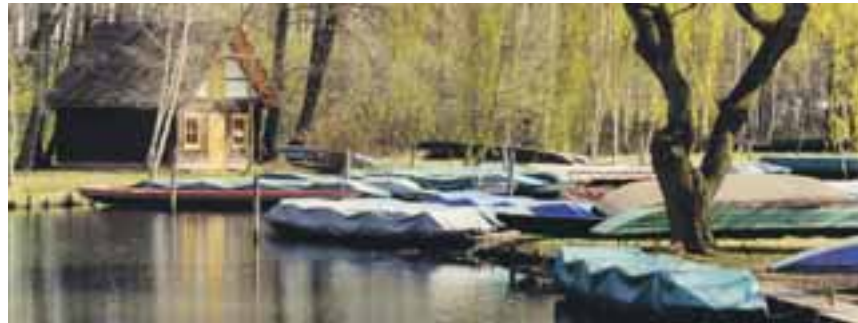
Winterschlaf? Bei Bedarf werden die Kähne geweckt.