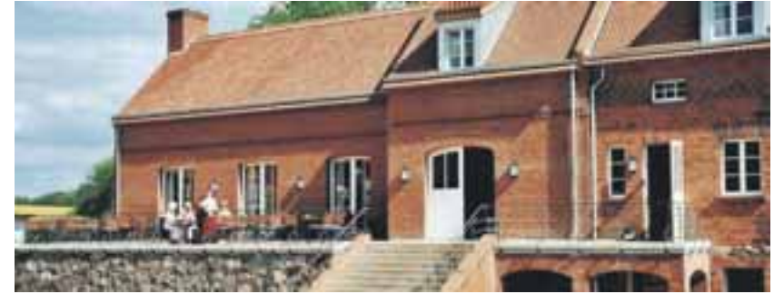
Wohnen beim Schlosswirt und das Schloss als Nachbar