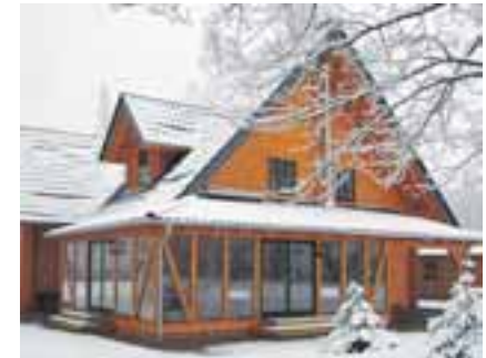
Seehotel mit vielen Überraschungen