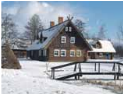
Spreewaldromantik in Burg