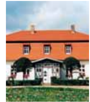
Königlich im Romantikhotel