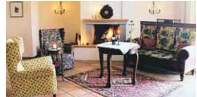
Seehotel Huberhof – Gemütlichkeit pur