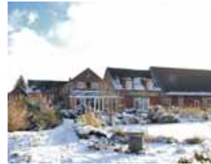
Aktive Erholung im Landhaus Alte Schmiede