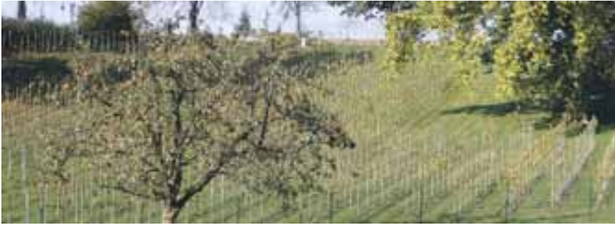
Herbstlicher Weinberg am Hotel Meseberg