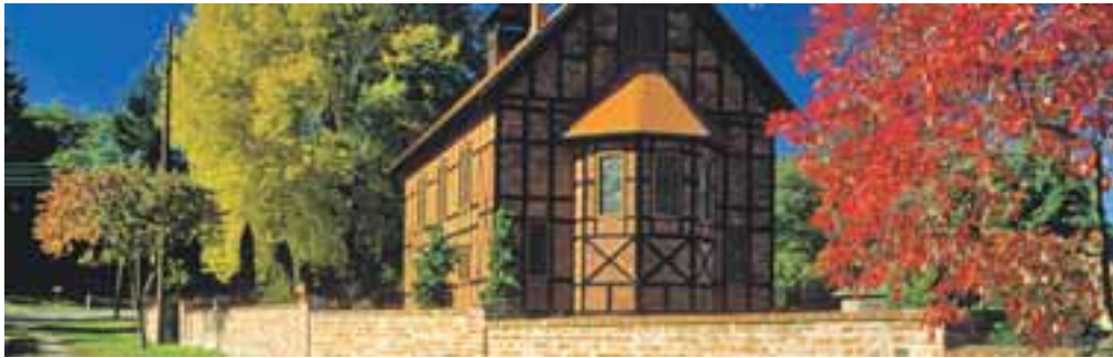
Goldener Herbst in Dippmannsdorf