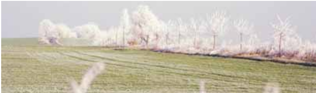
Zart wie ein Spitzendeckchen – Raureif in der Uckermark